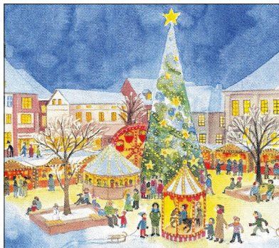
Zu jedem Weihnachtsfest der vergangenen Jahre gibt's eine Klappkarte mit Ratzeburg-Motiven. Hier der weihnachtliche Marktplatz.