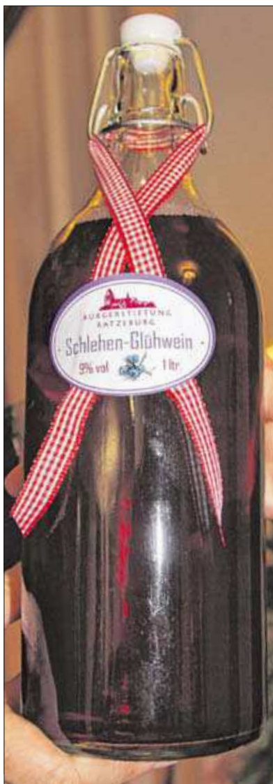
Den Schlehenglühwein gibt es in der Bügelflasche. Durch den fruchtigen Zusatz hat er eine ganz andere Note.