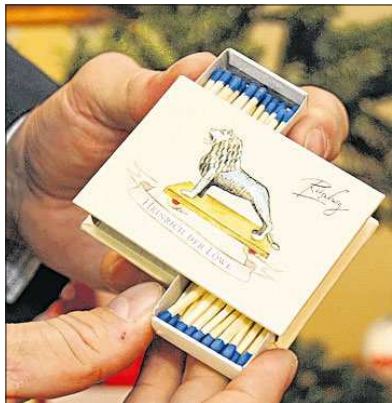
Künstlerisch gestaltete Zündholzschachteln mit dem Löwen, dem Symbol des Welfenherzogs, sind bei der Bürgerstiftung zu kaufen.