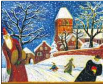
Auch das Motiv der Karte „Verschneiter Domhof“ wurde von der Ratzeburger Grafikerin Renate Hagenkötter illustriert.